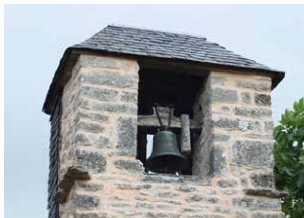
Chapelle de Favars