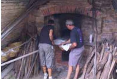
Fête votive : cuisson du pain