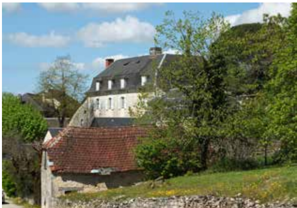
Village de Nespouls