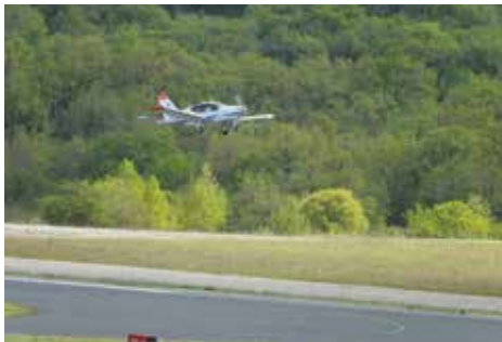
Aéroport Brive-Vallée de la Dordogne