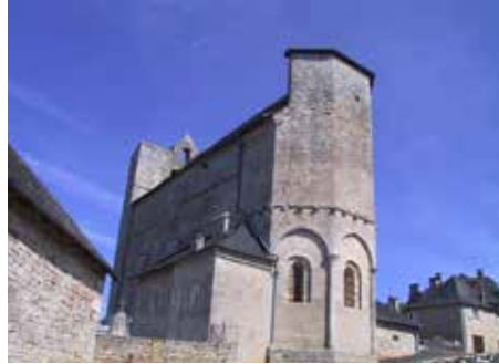
Église de Nespouls