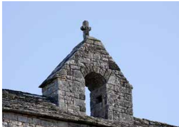
Clocher de l'église de Nespouls