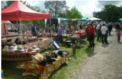
Foire de Belveyre