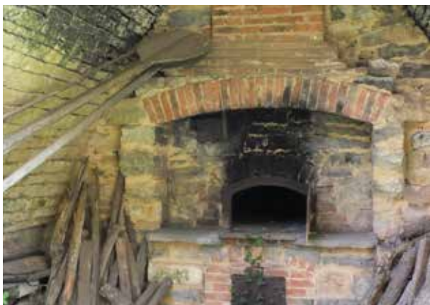
Four à pain