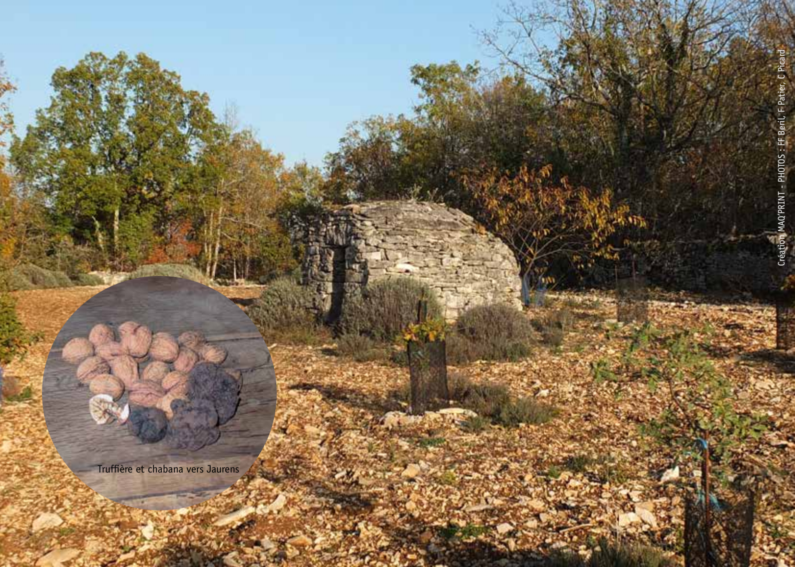
Truffière et chabana vers Jaurens