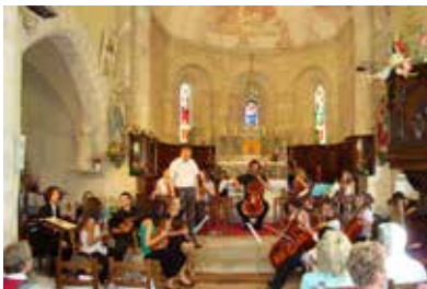
Concert à l'église